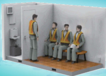
複数人が同時に休憩可能なスペース

一般的な車載休憩所よりも横幅をスマートにすることで2tロング車輛の積載を可能に。1車線の規制で運用を実現できます。